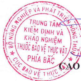
CAO TRUNG HIẾU

Ghi chú: : 1. Phiếu kết quả này chỉ có giá trị đối với mẫu do khách hàng mang đến 2. Các thông tin mục 00 do khách hàng khai báo và tự chịu trách nhiệm về nội dung đã khai. 3. Không được trích sao một phần kết quả này nếu không được sự đồng ý của TT KĐ&KN thuốc BVTV phía Bắc 4. Các chỉ tiêu đánh dấu sao (*) được thực hiện bởi nhà thầu phụ.